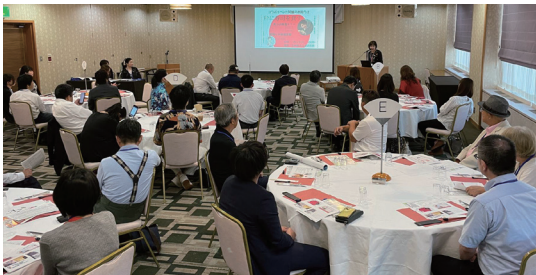
●定例会 企業PR、交流成果、近況報告などを行います。

尾張ビジネスクリエイトは 愛知県を中心とする中小企業の経営者・経営幹部が集い、 日々活発なビジネス交流を繰り広げております。 毎月第三金曜日18時から名古屋市内で定例会・懇親会を開催しております。 ビジネス交流に特化した異業種交流会です。 ご自身のビジネスの発展に、ぜひご参加ください！