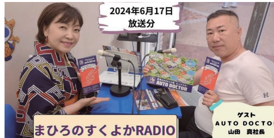
●メンバー同志がとても仲良し！ 様々な交流が活発に行われています。