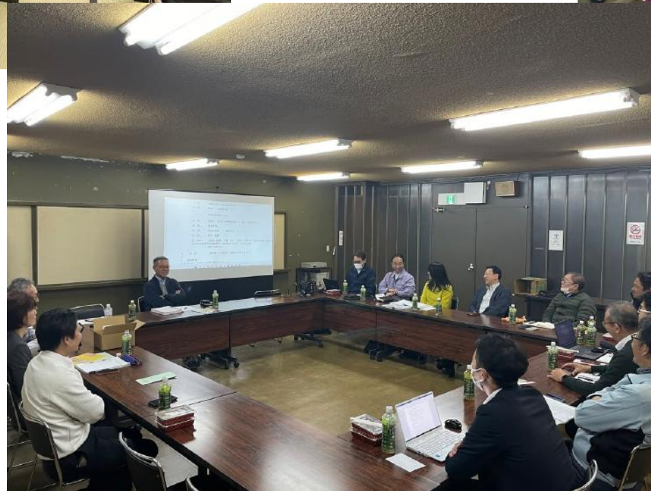
遠州ビジネス交流会